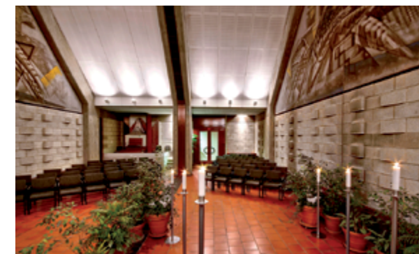
Das Krematorium Berlin-Ruhleben entstand in den Jahren 1972 bis 1975 nach den Plänen der Berliner Architekten Jan und Rolf Rave, deren Entwurf in einem 1962 ausgeschriebenen Wettbewerb als Sieger hervorgegangen war. Es sollte ein Ort werden, der sich deutlich von den frühen Bauformen des 19. Jahrhunderts unterscheidet und den Gestaltungsspielraum für individuelle Trauerfeiern erweitert. Die beiden Trauerhallen des Hauses für bis zu 60 bzw. 160 Personen sind mit Wandgemälden von Markus Lüpertz geschmückt.